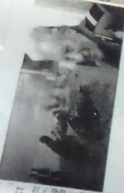
НЕ ЕСТЬ ПОБЕДИТЕЛЕЙ

Полные Кавалеры ордена Славы - Кривоярский край