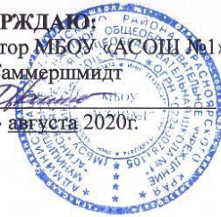
График дежурства педагогов по школе